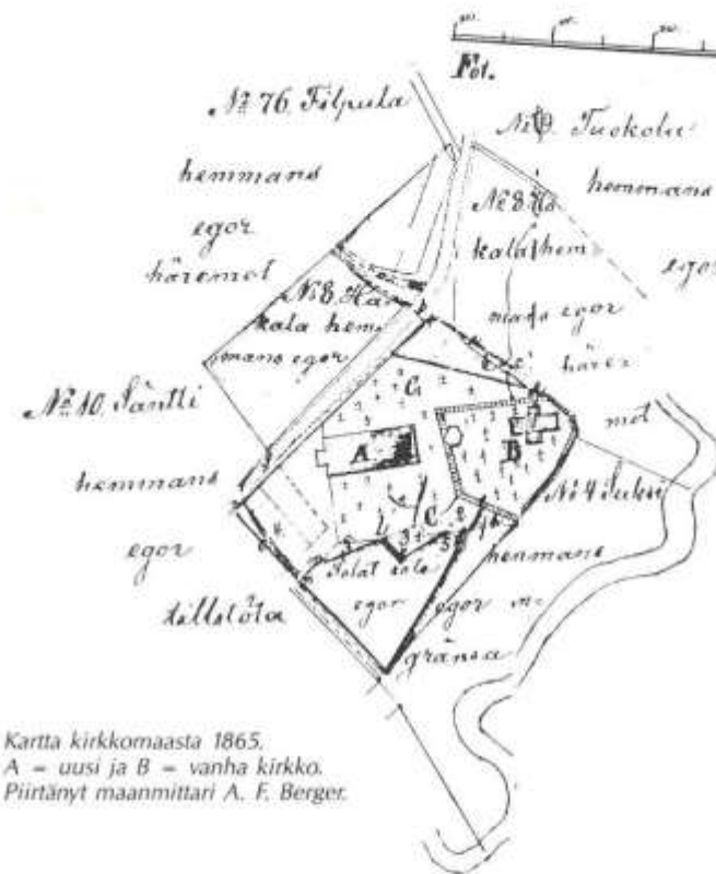
Kartta kirkkomaasta 1865. A = uusi ja B = vanha kirkko. Piirtänyt maanmittari A. F. Berger.

kirkkotyyppiä, jossa alttari oli itäpäässä ja sakaristo, kooltaan 7 x 7 metriä, sen vieressä pohjoispuolella. Eteinen oli länsipäädyssä ja papineteinen eteläpuolella. Vuosisadan lopulla se alkoi jälleen olla ahdas kasvaneelle seurakunnalle. Kirkkoa laajennettiin länsipäädyssä arkkitehti Johan Elfströmin 1783 laatimien piirustusten mukaisesti 1786–1787. Siitä tuli tuolloin 58 kyynärää pitkä, 18 kyynärää leveä ja 12