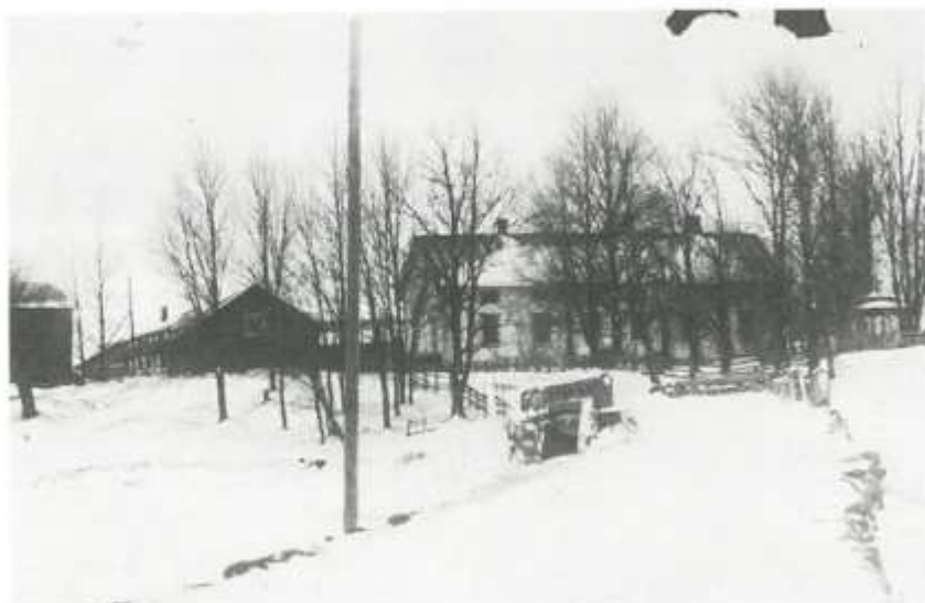
Kirkkoherran pappila Erkkilä.