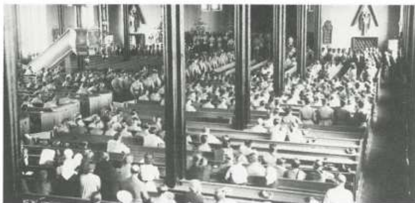
JR 58:n miehiä jumalanpalveluksessa ennen lähtöä jatkosotaan.