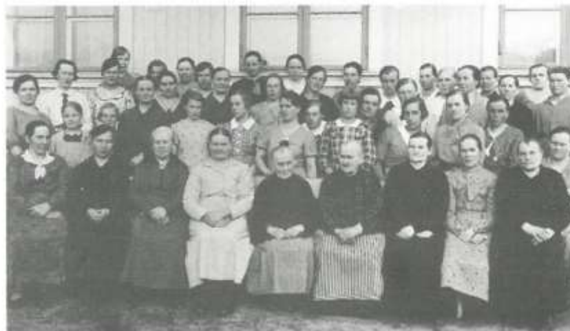
Diakoniaompeluseura seurakuntatalolla 1930-luvun lopulla.

jolloin talon asu palautui lähemmäs entistä pappila-aikaa ja käyttömahdol- lisuudet monipuolistuivat. Samalle tontille oli jo aiemmin rakennettu asuntola, joka sitten tuli korvaamaan suunnitelmat leirikeskuksesta meren tai järven rannalla.