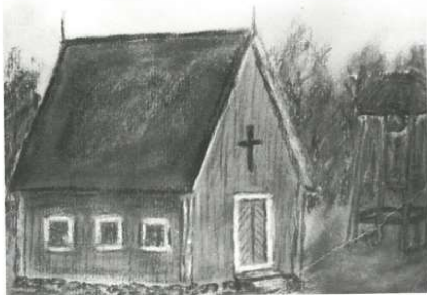
Saarnahuone 1600-luvulla. Perimätiedon pohjalta piirtänyt Paavo Suovaara.

Matka sisämaasta poikki metsien ja yli soiden Närpiön kirkkoon oli perin vaivalloinen. Toisaalta kirkko asetti velvollisuuksia jumalanpalveluksiin osallistumisesta. Enimmäkseen suomenkielinen teuvalaisväestö koki itsensä vieraaksi, vaikka kirkon tunnelma savupirtin väestä oli varmaan juhlava. Se alkoi anoa itselleen kirkollisia palveluja omalla kotiseudullaan. Vihdoin suostuttiin siihen, että joku Närpiön papeista kävi joka kolmas viikko pitämässä Teuvalla jumalanpalveluksen.