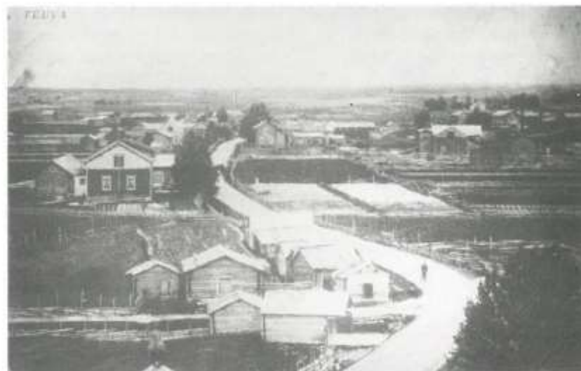
Kirkkotalleja Filppulan tien haarassa ennen 1910. Takana kansakoulu.

juhdilleen suojan. Kirkkotalleja teuvalaisilla oli ollut Närpiön yhteydessä. Eräät lienevät vieläkin olemassa. Horonkyläläiset viimeksi käyttivät siellä omia talleja. Oman kirkon läheisyyteen nousi myös jonkin verran suoja hevosille, ja palvelivat ne myös kirkkomatkalaisia vaatteiden vaihtopaikkana. Vielä 1900-luvun alun valokuvissa näkyy muutama vaja Filppulantien alus. Ne katosivat, kun seurakuntatalon taakse rakennettiin 1920-luvulla yhtenäiset tilat muutamalle kymmenelle hevoselle. Rakennus on osittain vielä paikallaan varastotilana.