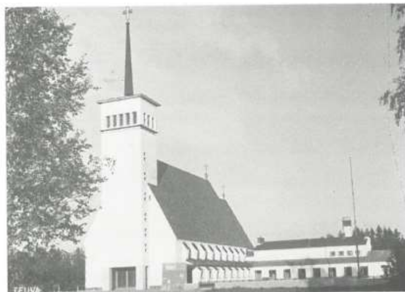
Seurakunnan nykyinen kirkko.

Kellotapuliin tulivat Närpiössä talletettuina olleet Jaakkiman kirkonkellot, joista toinen myöhemmin on korvattu uudella. Arkkitehdin suunnitelmiin eivät kattokruunut laisinkaan kuuluneet, ja kirkkoon ne sijoitettiin vasta 1978. Itse asiassa kruunut olivat olleet Teuvalle jo ennen kirkon paloa, sillä karjalainen Lumivaaran seurakunta oli tilan-