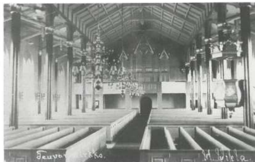
Kirkko 1930-luvun alussa.

Maantie kulki tuolloin lähempää joen rantaa kuin nykyisin. Uusi kirkko oli pystytetty poikittain maantien päälle, joten tämä oli siirrettävä nykyiselle kohdalleen. Rakennuksen molemmat päät tulivat pehmeälle alustalle, jonka vuoksi torni tehtiin aiottua matalammaksi. Rakennusvaiheessa osoitettu säästäväisyys perustuksen kohdalla osoittautui kohtalokkaaksi, ja valmis